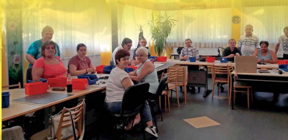
Munkavállalóink egy része... 😊