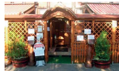
Marcal Étterem – Győr