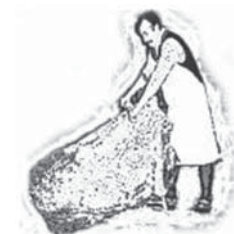
Szőrös Bőrös Bt.